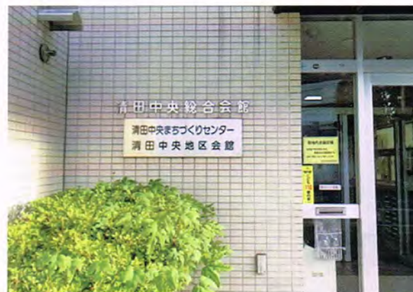
清田中央 まちづくりセンター

町連の活動をとおして清田中央地区がより住みよい街になりますよう祈念申し上げますとともに、微力ではありますが、私もお手伝いさせていただきたいと思ひます。