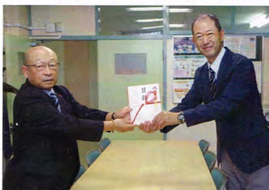
清田南小学校寄贈