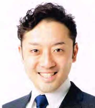
札幌市議会議員 清田中央地区町内会連合会 顧問