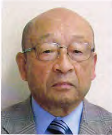
清田中央地区町内会連合会