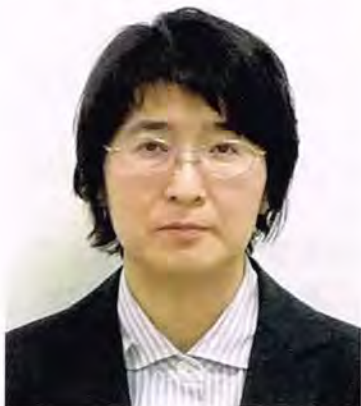
清田中央まちづくりセンター 第12代所長(平成27~28年度)