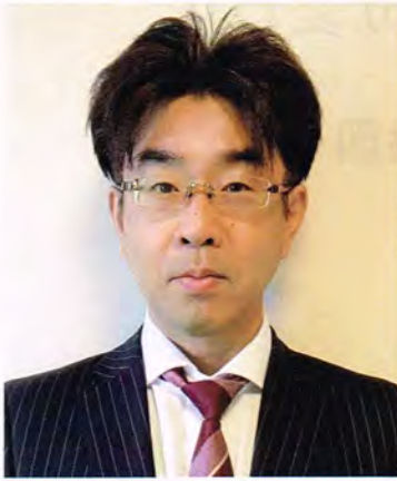
清田中央まちづくりセンター 第14代所長(令和2年度～)