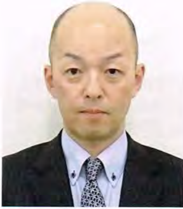
清田中央まちづくりセンター 第10代所長(平成22～23年度)