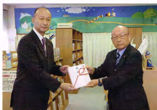
清田緑小学校寄贈