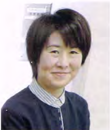
清田中央まちづくりセンター 第13代所長(平成29~令和元年度)

コロナ禍を境に支え合いのカタチは変わっていくかもしれませんが、皆で住みよいまちを目指す良き伝統が、今後も世代を超えて受け継がれていくことを切に願っております。