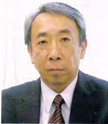
清田中央まちづくりセンター 第11代所長(平成24～26年度)

清田中央地区町内会連合会が、これからも温かな地域の輪として、ますます発展されることを心から願っております。